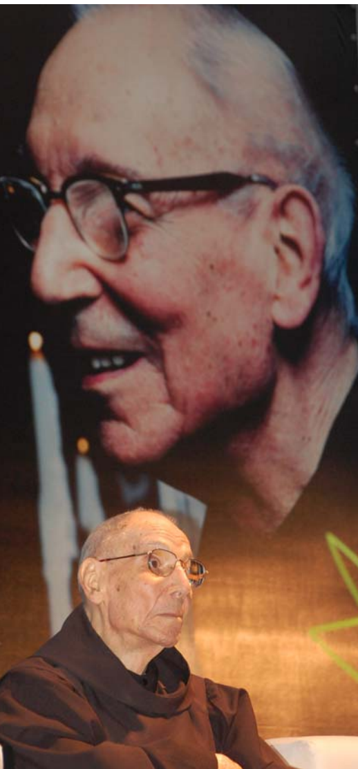
Educador respeitado em todo o país

Jornalista e membro da Academia Brasileira de Letras